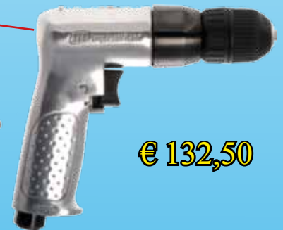
7802RA standaard boorkop, omkeerbaar in draairichting