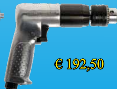
7803AKC sleutelvrije boorkop