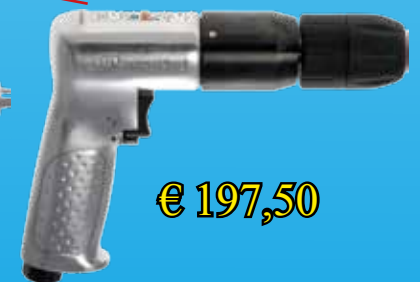
7803RA standaard boorkop, omkeerbaar in draairichting